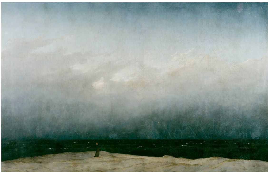
Caspar David Friedrich, Monk by the Sea (1808-10)

Bij het element aarde praten we met “Ik ben”. Ons lijf, de grond om ons heen, alles dat tastbaar is. In de pentakels zien we situaties van oogsten, samenwerken, relaties, geld. Alles dat we uit contact krijgen van de mensen en de aarde om ons heen.